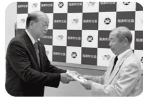
◀地域の皆様へのお礼と福祉のためにご寄附いただきました。(R6.5.29)