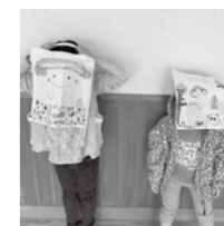
おもちゃライブラリー Instagram