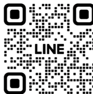
稲美町社会福祉協議会 公式ライン