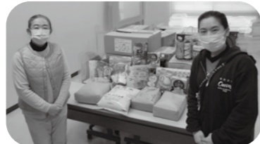
※②カーブス稲美様より (R5.2.16) 139名の利用者よりご自宅にある食品を提供いただきました。毎年のご協力ありがとうございます。