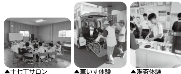
▲十七丁サロン ▲車いす体験 ▲喫茶体験