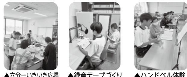
▲六分いきいき広場 ▲録音テープづくり ▲ハンドベル体験