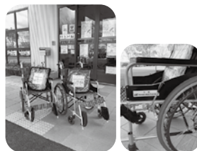
◀写真② 関西遊技機商業協同組合様より(R6.12.13)