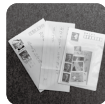
◀写真① 封書で届きました。ありがとうございました。(R6.12.9)