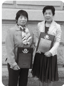
▲授賞式 (H30.11.5兵庫県公館)