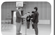
加古小学校より アルミ缶収集の収益から毎年のご寄附ありがとうございます。