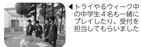
トライやるウィーク中の中学生4名と一緒にプレイしたり、受付を担当してもらいました