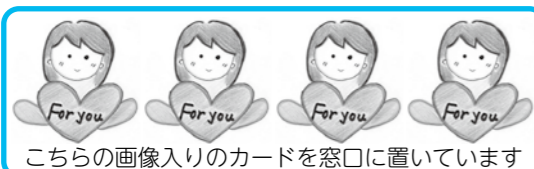
こちらの画像入りのカードを窓口においています

令和3年7月31日(土)まで 月～金曜日は13:00～17:00 土曜日は9:00～17:00