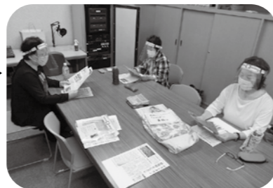
▲朗読ボランティアの皆さん (R3.6.4)