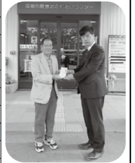
▲兵庫県信用組合 稲美支店様より